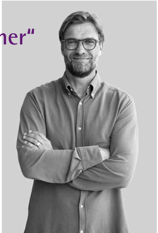
Jürgen Klopp, Fußballtrainer, ist ehrenamtlicher Botschafter der evangelischen Kirche für das Reformationsjubiläum 2017.

Am 31. Oktober 1517 hatte Martin Luther seine 95 Thesen gegen die Missstände der Kirche seiner Zeit veröffentlicht. „Luther war ein Kämpfer für die gute Sache“, sagt Jürgen Klopp, „ein Rebell um des Glaubens Willen, damit Menschen ihren Glauben ohne Angst und mündig leben können.“ Ein Vorbild. „Ich mag Luther, weil er für die Unterprivilegierten und Ausgeschlossenen gekämpft hat“, bekennt der gebürtige Stuttgarter. „Ihn wieder in unser Bewusstsein zu rufen, passt gerade jetzt sehr gut in unsere Zeit, in der wir viel darüber diskutieren, ob wir Menschen Zuflucht bieten oder sie ausschließen sollten.“ Für Jürgen Klopp steht fest: „Der liebende Gott, an den ich glaube, bei dem sind alle willkommen, ungeachtet ihrer Hautfarbe, ihrer Herkunft und ihrer Bildung.“ Der Trainer des FC Liverpool geht gern in Kirchen. „Das ist wie ein Vereinsheim, wo man reingehet und trifft die richtigen Leute.“ Er ist froh, dass er evangelisch ist und im Gottesdienst nicht auf die Knie fallen muss. Seine Knie seien nicht dafür gemacht, ständig zu knien, sagt er schmunzelnd. „Wir machen das ja nicht so oft.“